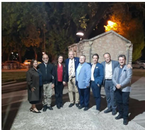
Στιγμιότυπο με τους συντελεστές του Μήνα Γιαννιώτικης Αργυροτεχνίας

Ο Μήνας Γιαννιώτικης Αργυροτεχνίας συνεχίζεται καθ' όλη τη διάρκεια του Μαΐου με ένα ευρύ και πολυεπίπεδο πρόγραμμα δράσεων, που περιλαμβάνει εκθέσεις, μουσειακές παρουσιάσεις, εκθέσεις φωτογραφίας, ανοιχτά εργαστήρια και εκπαιδευτικά προγράμματα, επιβεβαιώνοντας ότι τα Ιωάννινα παραμένουν η πόλη των ασημουργών και ένας ζωντανός πυρήνας δημιουργίας με βαθιές ρίζες και σύγχρονη προοπτική.